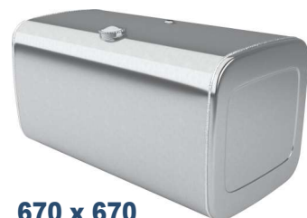
670 x 670