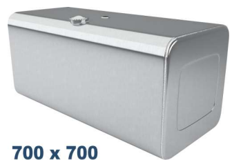
700 x 700