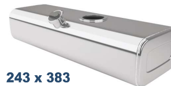
243 x 383