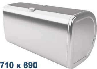
710 x 690