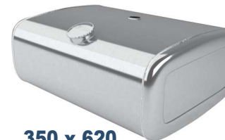
350 x 620