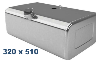
320 x 510