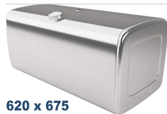
620 x 675