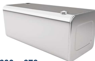
600 x 670