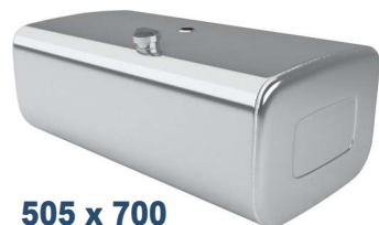
505 x 700