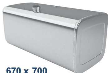
670 x 700