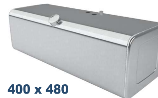
400 x 480