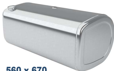
560 x 670